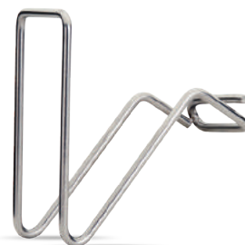
SUPORTE CATAPLANA Amovível e adaptável a todos os tamanhos da Cataplana Algarve